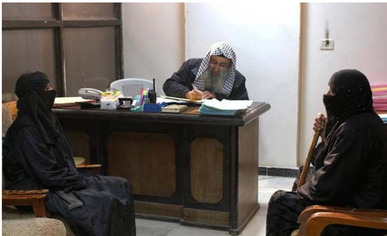
Foto fra den IS-kontrollerede syriske by Raqqa. Det er primært andre kvinder, der rekrutterer unge kvinder i Europa til at slutte sig til IS kamp i det krigshægede land.

Det kræver en individuel plan at redde unge piger ud af Islamisk Stats klør, fortæller to anti-radikaliseringsekspertter. Men det kan være svært at finde et gymnasium eller et job, hvor en pige med niqab bliver accepteret