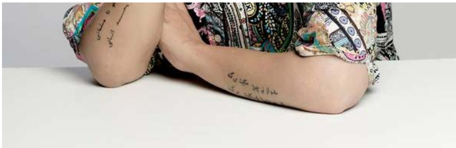
Khaterah Parwanis opslag er blevet delt mere end 3500 gange.